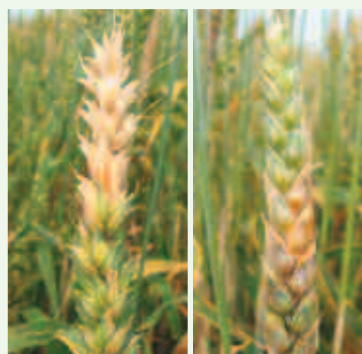
Symptome von Fusarium graminearum auf Weizen.

Fusarienkomplex und Infektionsverlauf Ährenfusariosen werden in der Schweiz durch verschiedene Fusarien-Arten verursacht. Weitaus häufigste Art ist Fusarium graminearum (FG). Infektionen durch FG erfolgen meistens von befallenen Pflanzenresten der Vorkultur (z.B. Mais, Getreide) auf der Bodenoberfläche aus (Grafik). Speziell gefährlich sind ab Beginn bis Ende Getreideblüte freigesetzte Sporen, die mit Wind oder Regenspritzern auf die