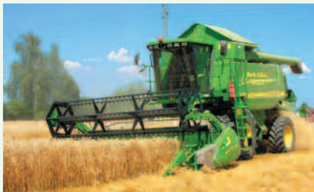
Der Mähdrescher ist so einzustellen, dass viele Strohanteile, Spelzen und Schmachtkörner ausgeschieden werden.

Die Produktion von gesunden Nahrungs- und Futtermitteln muss im Zentrum aller anbautechnischen Massnahmen stehen (siehe Seite 2 und 3).