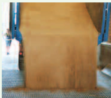
Vor der Entladung in die Gasse ist die Lieferung visuell zu kontrollieren.