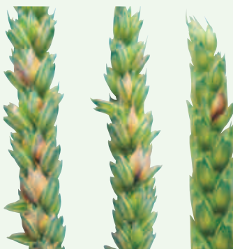
Symptome von Fusarium poae auf Ähren der Weizensorten Arbola (links) und Titlis (rechts).