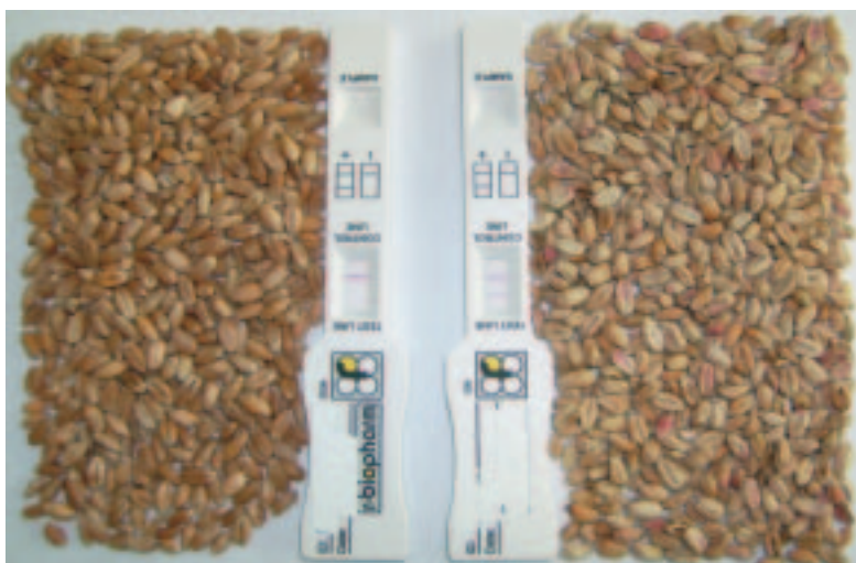
Le test de gauche est négatif pour le DON, celui de droit est positif.

Au champ, les épis blanchâtres avec une attaque de champignons d'une couleur partiellement saumonée à proximité du fuseau sont symptomatiques pour une infestation de fusariose. Dans les lots moissonnés, une proportion de plus de 10 % de grains blancs ou rougeâtres, ou une proportion élevée de grains échaudés, sont des signes irréfutables que les céréales livrées peuvent comporter une teneur en mycotoxines trop élevée. Lorsque les producteurs livrent leurs céréales, il faut accorder une attention particulière aux céréales qui, durant la culture, ont été exposées aux facteurs de risque. Un lot livré par un agriculteur peut certes être net-