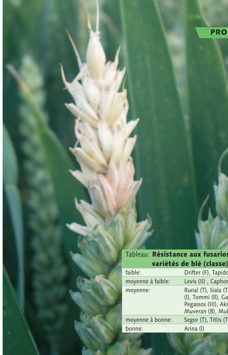
Fusariose sur épi.

Dans le secteur fourrager, les valeurs d'orientation pour les mycotoxines édictées par Agroscope Liebefeld-Posieux (ALP) demeurent inchangées. Pour le DON chez les bovins, la volaille, les équidés et les lapins, ces valeurs sont fixées à 5 mg/kg, pour les veaux à 2 mg/kg et pour les porcs à 0.9 mg/kg. La valeur d'orientation se rapporte cependant à l'ensemble de l'aliment mélangé, qui peut donc être constitué de différents composants. Ce faisant, des lots de blé panifiable retirés du circuit des denrées alimentaires peuvent être utilisés pour l'alimentation des ruminants. Mais dans ce cas-là également, il y a des limites. Aucun fabricant responsable d'aliments mélangés n'est disposé à «recycler» ainsi des composants avec des charges trop élevées et à s'exposer ainsi à un risque en matière de santé des animaux. De plus, les possibi-